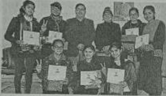
कार्यक्रम में विजेता कोसली राजकीय कॉलेज की छात्रों को सम्मानित करते प्रचार्य।