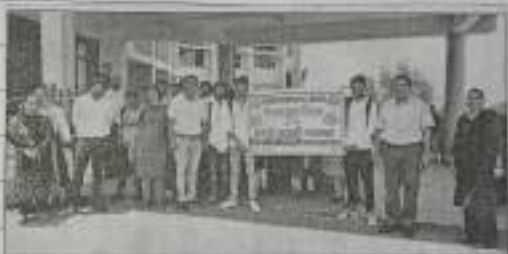
कोसली राजकीय महाविद्यालय में नए के डिप्लोमा अभ्यास में नई विद्यार्थियों छात्र।