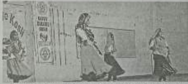
राजकीय महाविद्यालय कोसली में आयोजित प्रतिभा खोज प्रतियोगिता के दौरान हरियाणवी नृत्य प्रस्तुत करती छात्राएं