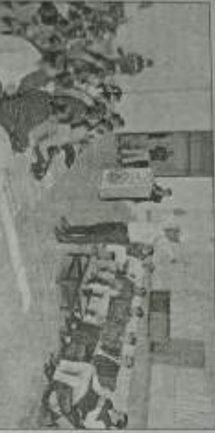
यातायात नियमों के बारे में जानकारी देना डीएसपी पुलिसकर्मी।