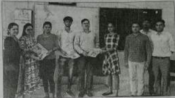
विजेता छात्रा को सम्मानित करते प्राचार्य। सच