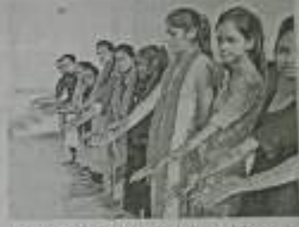
छात्राओं ने स्लोगन में ग्रीटिंग प्रतियोगिता में भी भाग लिया।