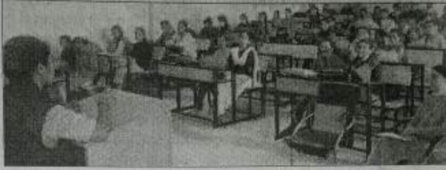
कार्यक्रम में उपस्थित छात्राएं। संवाद