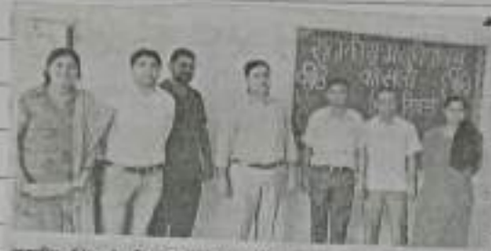
राजकीय कॉलेज कोसली में हिंदी विद्या पर आयोजित कार्यक्रम में लग रहे स्टाफ सदस्य

विषय -> राजकीय कॉलेज कोसली जे. हिंदी विद्या पर आयोजित कार्यक्रम दिनांक - 15/09/19