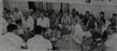
राजकीय कॉलेज कोसली में हवन पूजा करते स्टूडेंट्स।