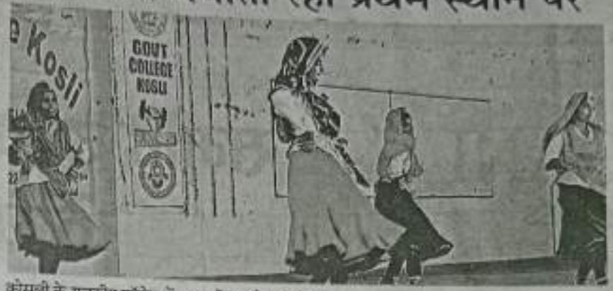
कोसली के राजकीय कॉलेज में हुआ प्रतिभा खोज कार्यक्रम।