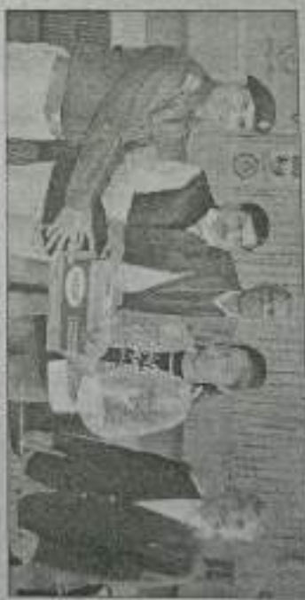
धारा का हेतुबद्ध विनियम बनाने डीएसपी सीटिंग मीटिंग।